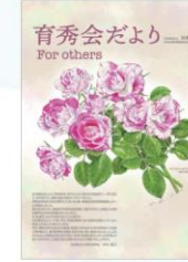
令和元年(2019)発行 バラ「フラッシュダンス」