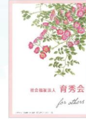
法人パンフレット ガーデンローズ

先生は、第3育秀苑地域交流室で、多くの方に絵を教えていらっしゃいました。先生やその生徒さんの作品を苑内に展示しています。ご協力いただいている先生の作品は、繊細で美しく描かれたボタニカルアートで、当法人パンフレットを始め各広報誌の表紙でご覧いただけます。その表紙に魅かれて冊子を手にとっていただくこともあり、大変嬉しく思います。