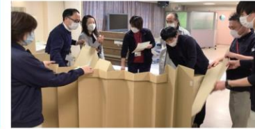
簡易間仕切りによる居住スペース設置訓練

練馬区より「災害発生時における福祉避難所」として、育秀会の施設が指定されています。「福祉避難所」は、区立小中学校などの避難拠点(避難所)での生活が困難な高齢者や障害者など、特別な配慮を必要とする方を受け入れる場所です。災害を想定し、平常時からさまざまな対応のシミュレーション訓練を行っています。