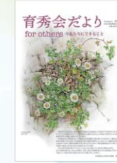
令和2年(2020)発行 アシズリジギク