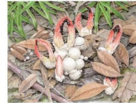
カニノツメ(アカカゴタケ科) 石神井公園で