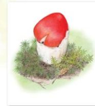
本号表紙作品 タマゴタケ(テングタケ科) 北軽井沢で

※「ボタニカルアート」…博物画の一種。植物学的な芸術でその植物の特徴が正確に且つ美しく描かれている絵画のことです。