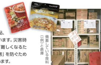
(左)備蓄している食料

施設では、災害に備えて3日分の水と食糧、衛生用品、防災用品などを備蓄しています。災害時の非常食は野菜の摂取が難しくなるため、体調不良等の「健康被害」を防ぐために栄養面でも気を付けています。