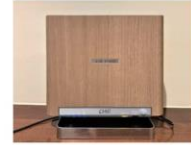
浮遊ウイルスを除去するといわれているオゾン発生器を設置しています。