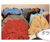
ボランティアさんから 頂きました