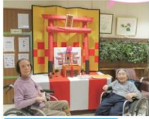
第3育秀苑神社で初詣