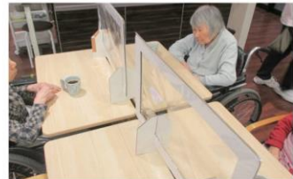
各フロアのテーブルや事務所のデスク周りに飛沫防止パーテーションを設置しています。