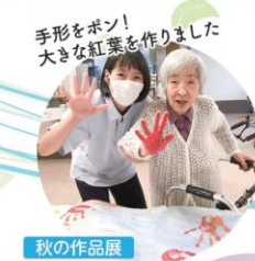
秋の作品展 (Autumn Art Exhibition)

コロナ禍により、レクリエーション活動や面会等が制限されてしまいました。そのため今まで以上にひとつひとつの活動を大切に、レクリエーションでは装飾や展示物を利用者様と一緒に作って飾り、季節等を感じられるように工夫をしています。利用者様と笑顔と心で繋がっていきけるように、言葉だけでなく表情や仕草にも意識を向けて、より深く気持ちに寄り添っていきけるよう心掛けてまいります。