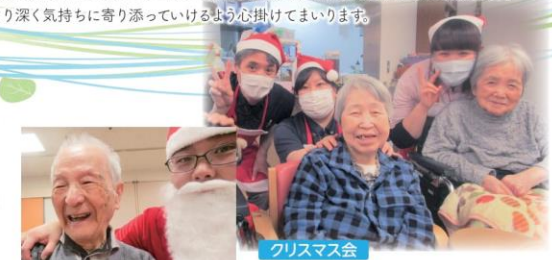
クリスマス会 (Christmas Party)

大きくてフレンドリーなサンタさんの登場に素敵な笑顔! (A big and friendly Santa Claus's appearance with wonderful smiles!).